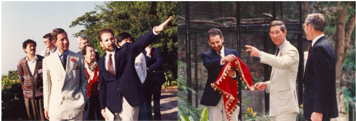
<圖 2 – 查理斯王子於 1994 年參觀嘉道理農場>

Project，簡稱 HKHP），以嘉道理家族及其在香港及其他地方的業務發展及慈善事業為著眼點，廣泛收集和整理有關的歷史文件、照片、錄像和口述記錄檔案，並公開予各界人士分享。該項目得到香港上海大酒店有限公司全力贊助及支持。 ( www.hongkongheritage.org )